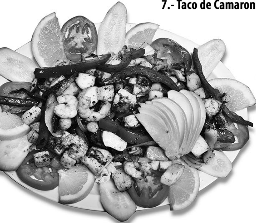
7.- Taco de Camaron

500 Kansas Ave Ste. A Modesto, Ca 95351 (209) 567-2562