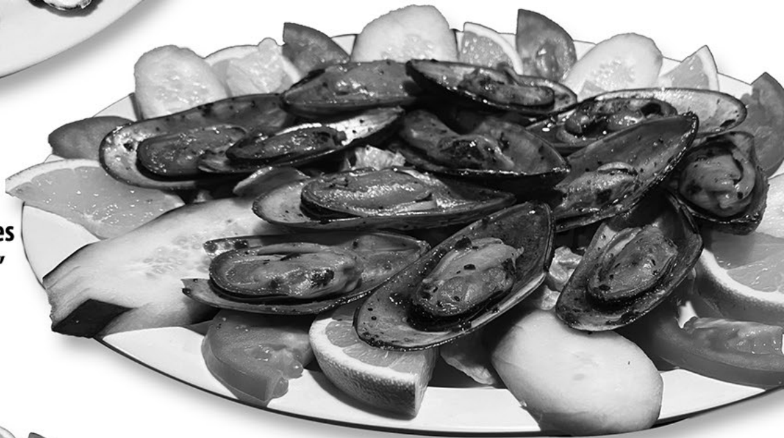
Mejillones "El Jefe"