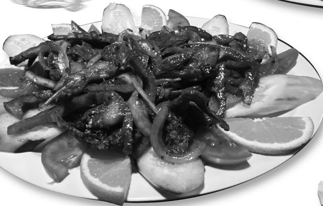
Botana de Guilotas