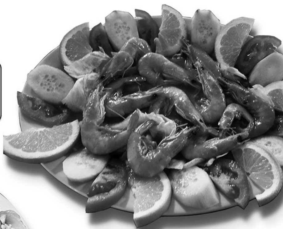
Camarones a go-go

500 Kansas Ave Ste. A Modesto, Ca 95351 (209) 567-2562