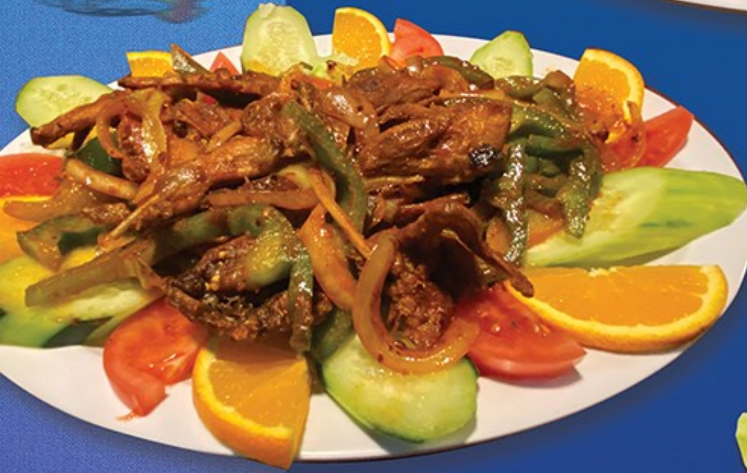
Botana de Guilotas