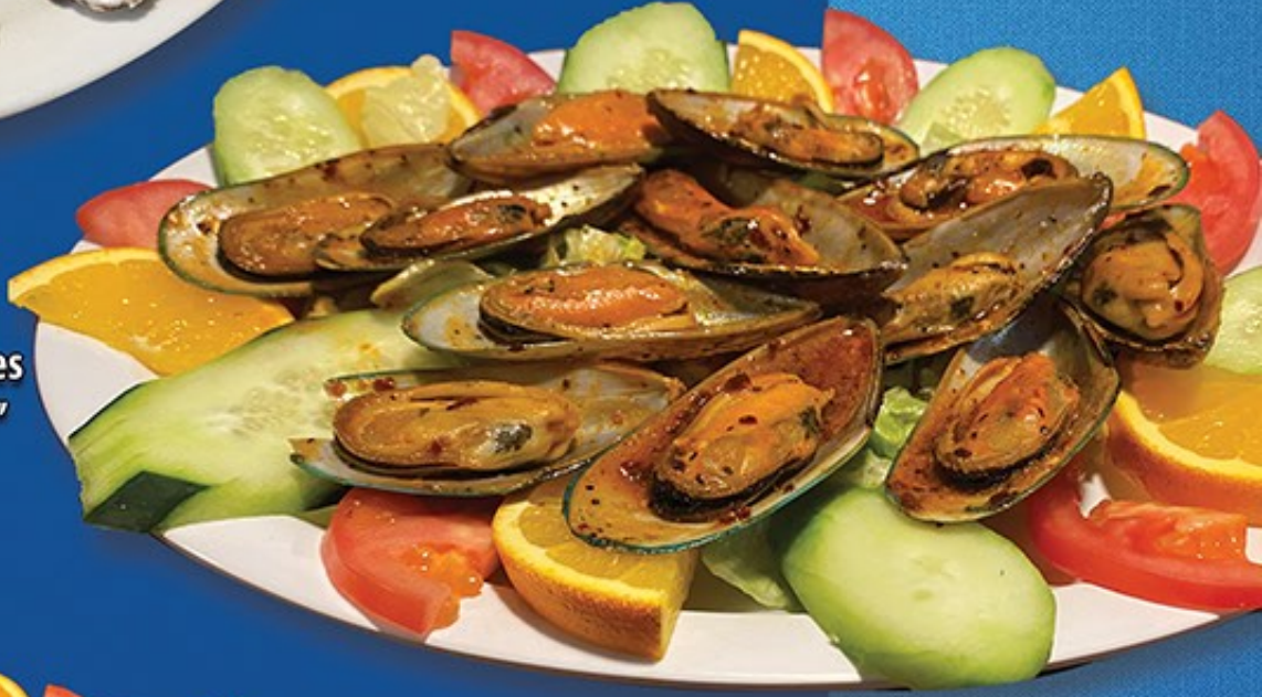
Mejillones "El Jefe"