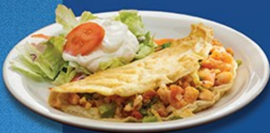
7.- Taco de Camaron