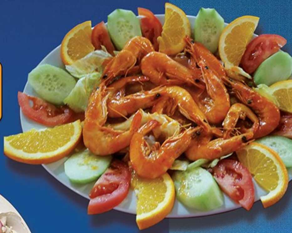
Camarones a go-go

500 Kansas Ave Ste. A Modesto, Ca 95351 (209) 567-2562